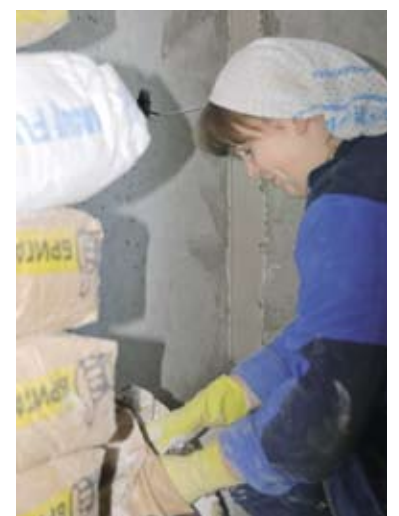
Работа с цементом — не из легких

годы, и всякие реструктуризации, чего только не было! Сейчас вот все кризиса боятся. Да чего его бояться, мы уже такое пережили, что теперь ничего не страшно! Ну, кризис еще один. Ну, бывает. Мы и не такое видали. Страшно, когда ты один и без работы. А с коллективом, с Трестом нам все трудности нипочем.