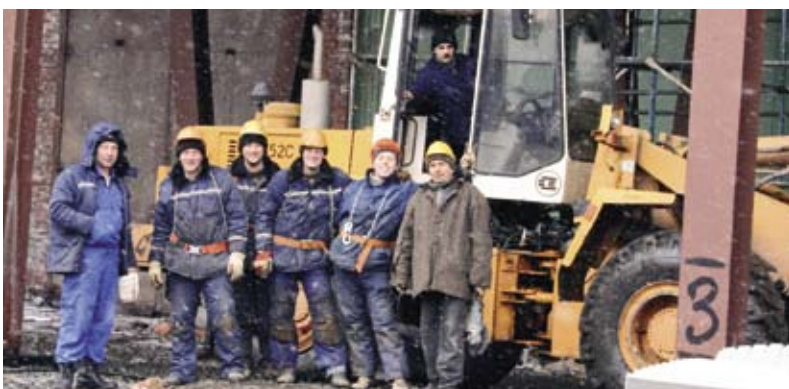
Монтажники строительного участка №5

Е. Швыркалова.